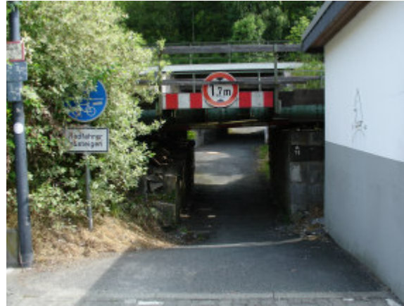
Die Unterführung im Bereich der Tankstelle Friederichs, marode und mit geringer Kopfhöhe, kann künftig entfallen.