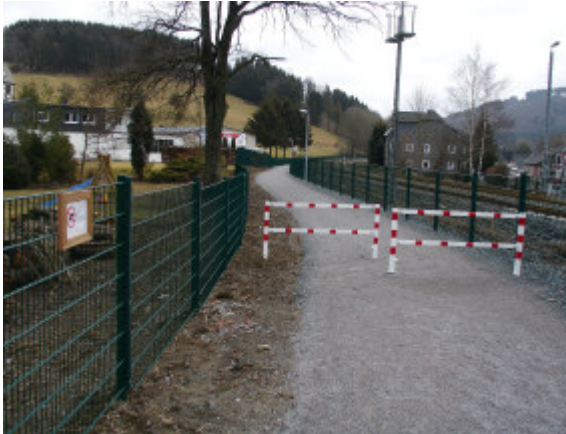
Unmittelbar an der Bahnstrecke entlang führt der neue Verbindungsweg vom Ortskern Richtung Dümel.