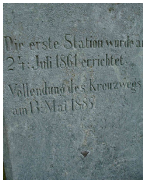
In Stein gemeißelt: Von 1861 bis 1885 hat es eine ganze Generation gedauert, bis die Nuttlarer ihren Kreuzweg vollenden konnten.